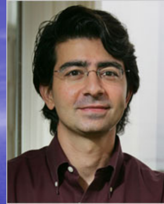
Pierre Omidyar (eBay)