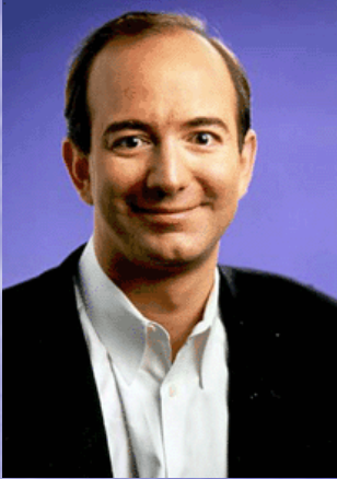
Jeff Bezos (Amazon.com)