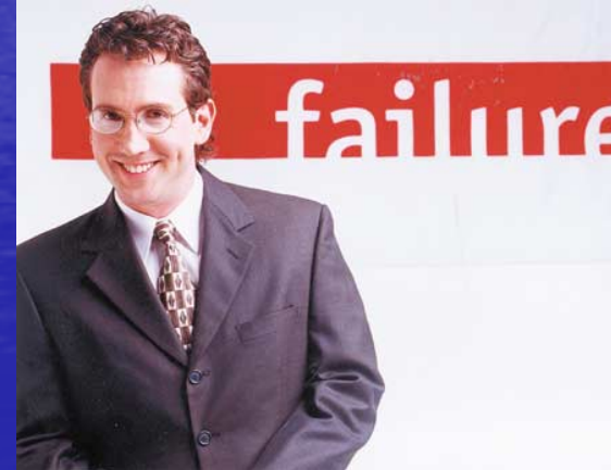
Jason Zasky, (Failure Magazine)